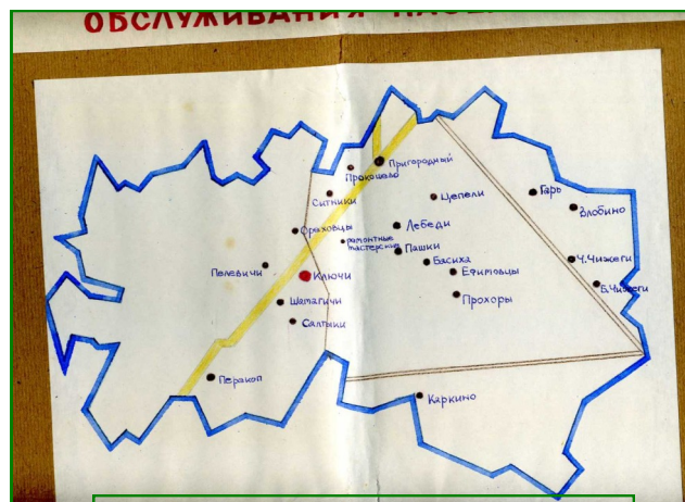
Карта библиотечного обслуживания