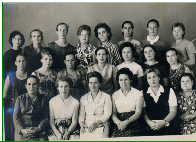
Библиотекари Кирово-Чепецкого района (конец шестидесятых годов)

В это время до централизации было еще достаточно далеко, но центральная библиотека оказывала методическую помощь сельским коллегам. Это нашло отражение во многих рабочих моментах. Например, перед знаменательными датами (юбилеями событий, связанными с революцией, партийными съездами и так далее) в район рассылались специальные альбомы, где каждый сельский библиотекарь отмечал свои достижения.