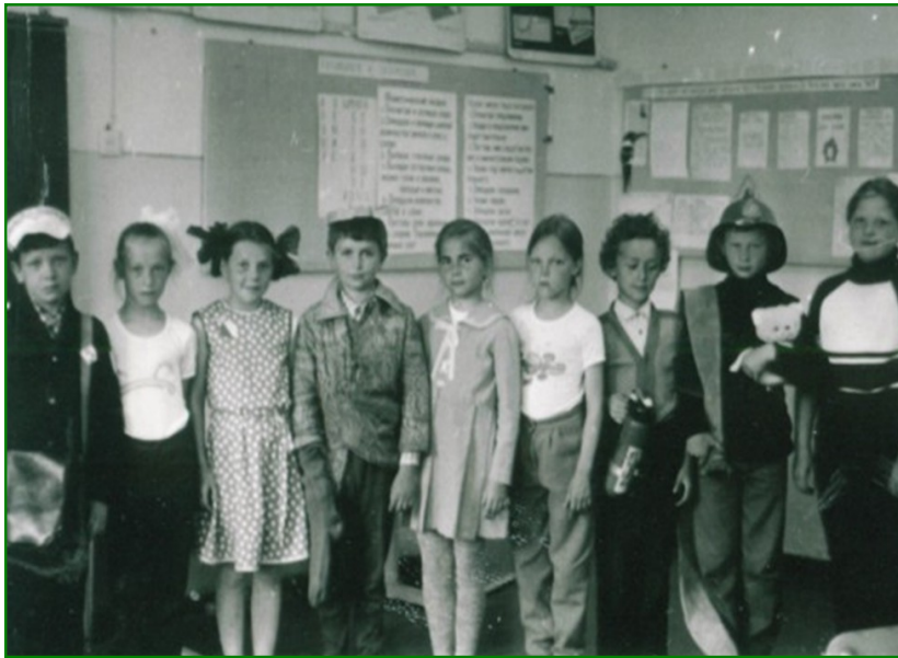
Юные читатели библиотеки районной детской библиотеки