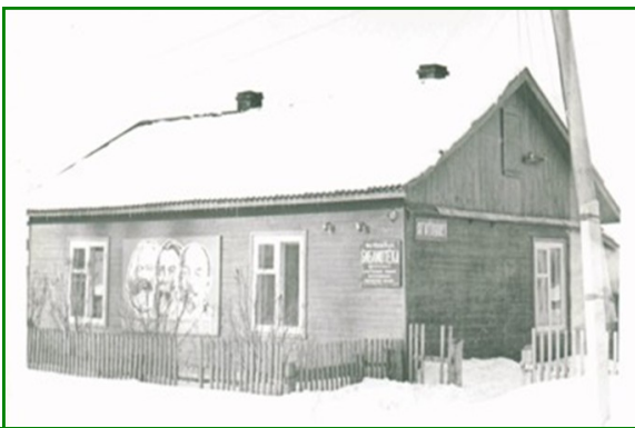
Здание Малоконыпской библиотеки