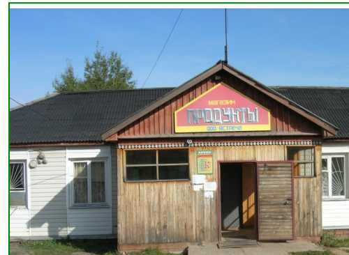
Здесь располагалась Пасеговская библиотека

Огромное значение придавалось прославлению человека труда.