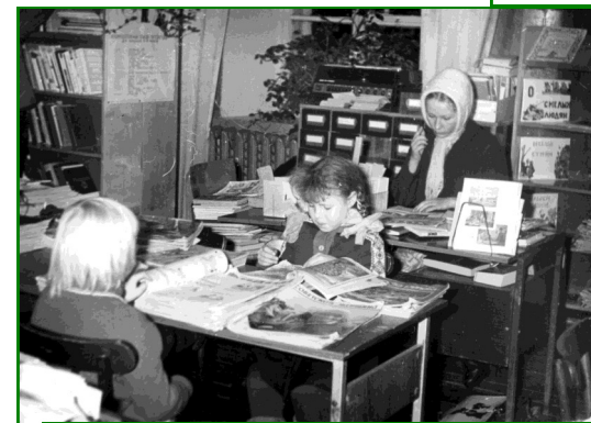
В районной детской библиотеке (районный дом культуры)