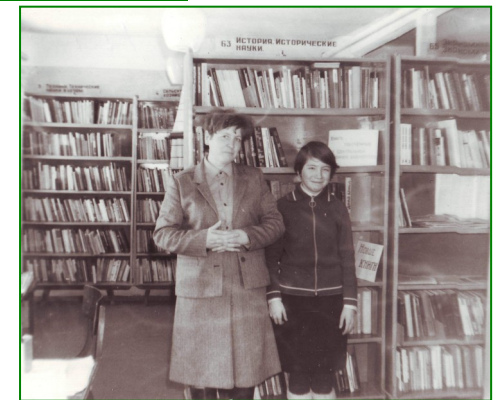
Библиотечная династия Батуриных (Пасеговская библиотека)