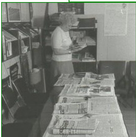
На выставке советских газет