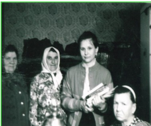
Обычные дела: Фатеевская библиотека, Р. Чайникова