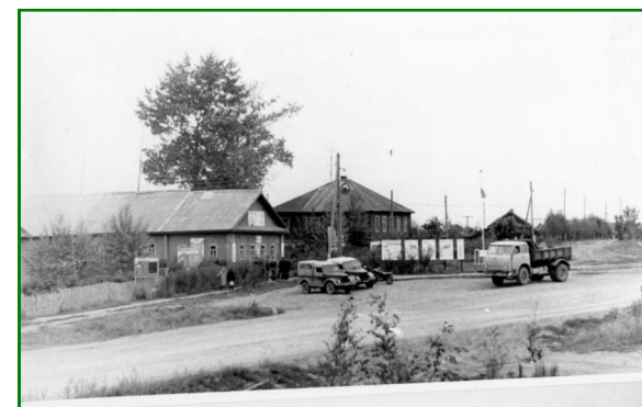
Здание Филипповской библиотеки