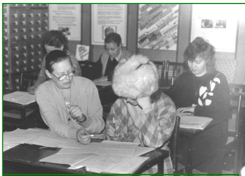
На одном из семинаров