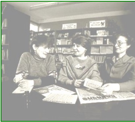
Подготовка мероприятия: Центральная районная библиотека

Это был «человек творческий, работающий, всегда полон дум, планов, поисков. Она проводила «громкие читки», обзоры литературы, устные журналы и беседы.