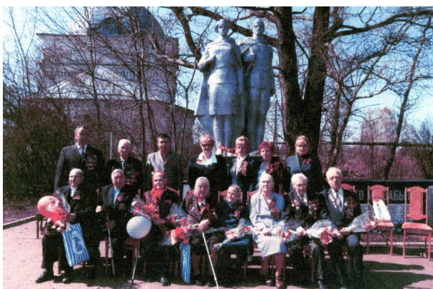
Памятник воинам-землякам в с. Пасегово