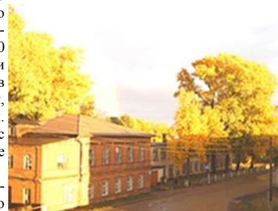
Здание школы в с. Пасегово