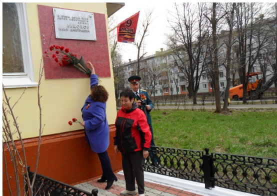
Мемориальная доска в г. Северск